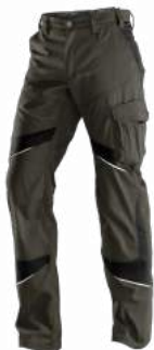
Oliv | Schwarz 2550 5365-6699 D34-D54