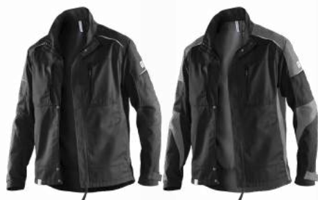
Schwarz 1250 5365-99 XS-4XL