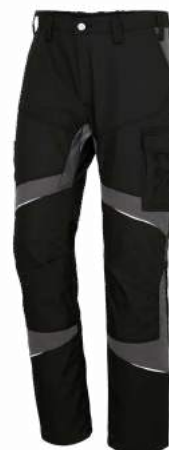
Schwarz | Anthrazit 2150 5365-9997 40-66, 90-118, 25-31