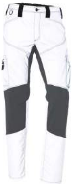
Weiß | Anthrazit 2850 5231-1097 40-66, 90-118, 25-31