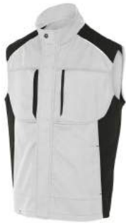
Weiß | Anthrazit 7250 5365-1097 XS-4XL