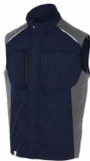
Dunkelblau | Anthrazit 7250 5365-4897 XS-4XL