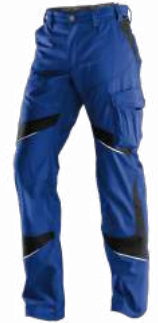
Kbl.blau | Schwarz 2550 5365-4699 D34-D54