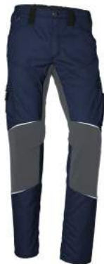
Dunkelblau | Anthrazit 2850 5231-4897 40-66, 90-118, 25-31