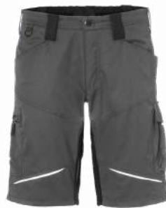
Anthrazit | Schwarz 2950 5231-9799 40-64