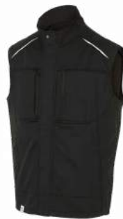
Schwarz 7250 5365-99 XS-4XL