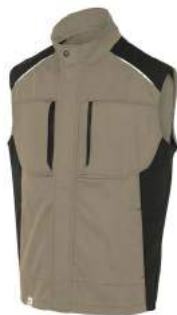
Sandbraun | Schwarz 7250 5365-2599 XS-4XL