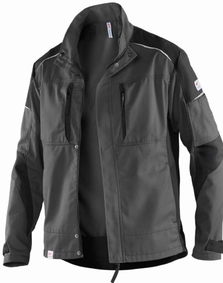
Anthrazit | Schwarz 1250 5365-9799 XS-4XL