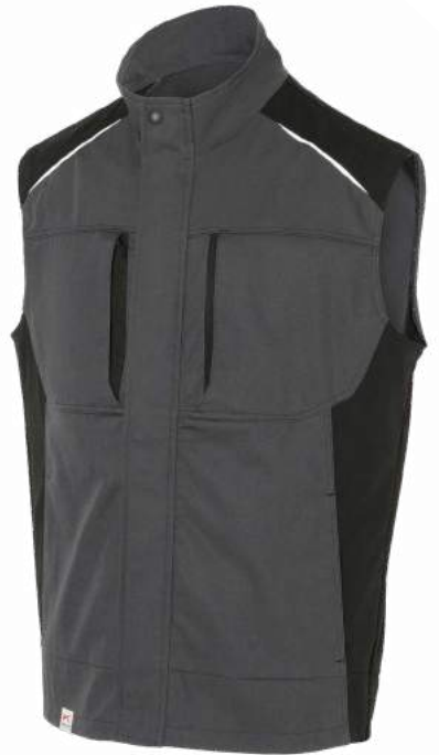
Anthrazit | Schwarz 7250 5365-9799 XS-4XL