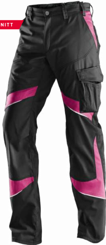
Schwarz | Pink 2550 5365-9952 D34-D54