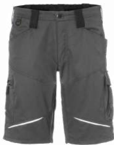
Anthrazit 2950 5231-97 40-64