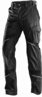
Anthrazit 2550 5365-97 D34-D54