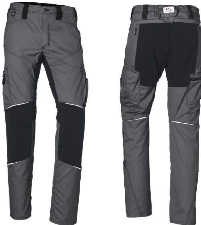
Anthrazit | Schwarz 2850 5231-9799 40-66, 90-118, 25-31