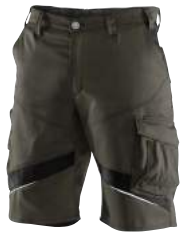
Oliv | Schwarz 2450 5365-6699 40-66