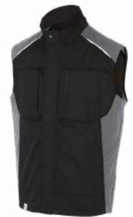
Schwarz | Anthrazit 7250 5365-9997 XS-4XL