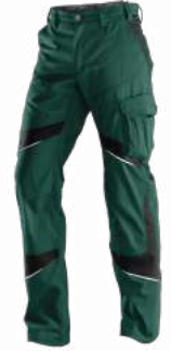
Moosgrün | Schwarz 2550 5365-6599 D34-D54