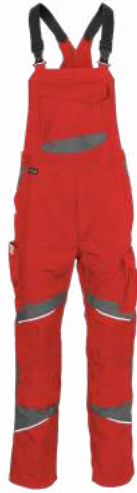
Mittelrot | Anthrazit 3450 3421-5597 40-66, 90-118, 25-31