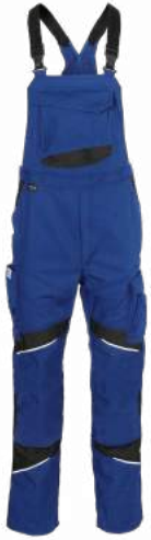
Kbl.blau | Schwarz 3450 3421-4699 40-66, 90-118, 25-31