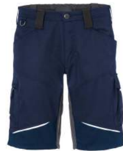
Dunkelblau | Anthrazit 2950 5231-4897 40-64