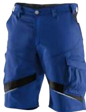
Kbl.blau | Schwarz 2450 5365-4699 40-66