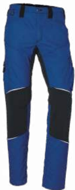
Kbl.blau | Schwarz 2850 5231-4699 40-66, 90-118, 25-31