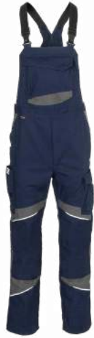
Dunkelblau | Anthrazit 3450 3421-4897 40-66, 90-118, 25-31