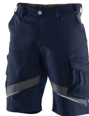
Dunkelblau | Anthrazit 2450 5365-4897 40-66