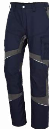
Dunkelblau | Anthrazit 2150 5365-4897 40-66, 90-118, 25-31