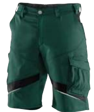
Moosgrün | Schwarz 2450 5365-6599 40-66