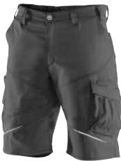
Anthrazit 2450 5365-97 40-66