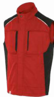
Mittelrot | Schwarz 7250 5365-5599 XS-4XL