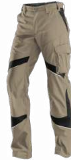
Sandbraun | Schwarz 2550 5365-2599 D34-D54