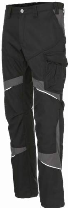
Schwarz | Anthrazit 2550 3421-9997 D34-D54