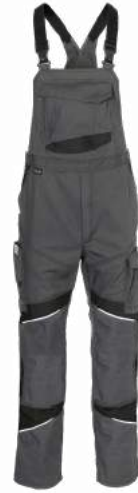
Anthrazit | Schwarz 3450 3421-9799 40-66, 90-118, 25-31