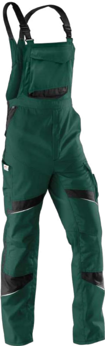
Moosgrün | Schwarz 3250 5365-6599 40-66, 90-118, 25-31