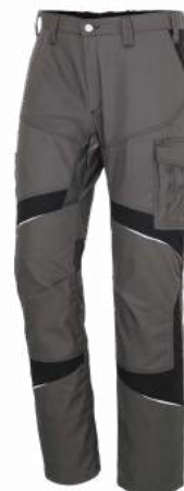
Kbl.blau | Schwarz 2150 5365-4699 40-66, 90-118, 25-31