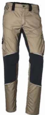
Sandbraun | Schwarz 2850 5231-2599 40-66, 90-118, 25-31