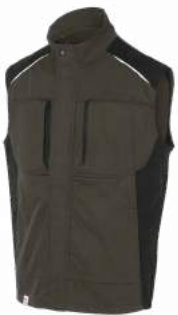
Oliv | Schwarz 7250 5365-6699 XS-4XL