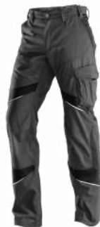
Anthrazit | Schwarz 2550 5365-9799 D34-D54