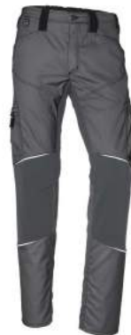
Anthrazit 2850 5231-97 40-66, 90-118, 25-31