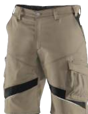
Sandbraun | Schwarz 2450 5365-2599 40-66