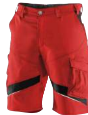
Mittelrot | Schwarz 2450 5365-5599 40-66