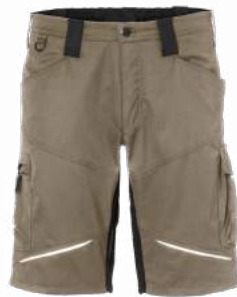
Sandbraun | Schwarz 2950 5231-2599 40-64