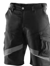
Schwarz | Anthrazit 2450 5365-9997 40-66