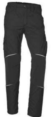
Schwarz 2850 5231-99 40-66, 90-118, 25-31