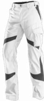
Weiß | Anthrazit 2550 5365-1097 D34-D54