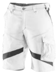
Weiß | Anthrazit 2450 5365-1097 40-66