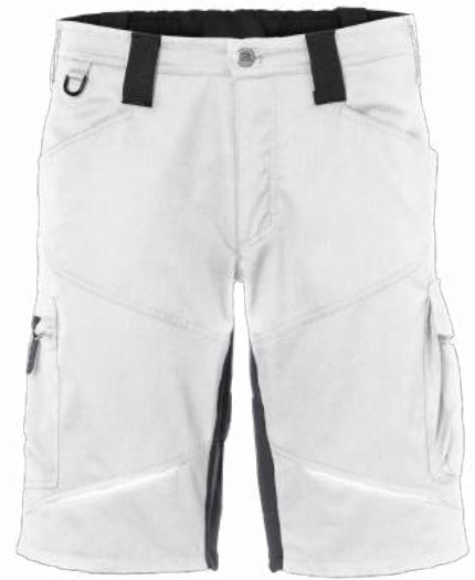
Weiß | Anthrazit 2950 5231-1097 40-64