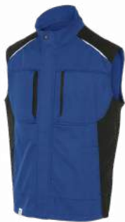
Kbl.blau | Schwarz 7250 5365-4699 XS-4XL