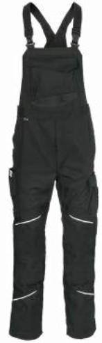
Schwarz 3450 3421-99 40-66, 90-118, 25-31