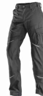
Schwarz 2550 5365-99 D34-D54