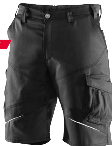
Schwarz 2650 5365-99 D34-D54