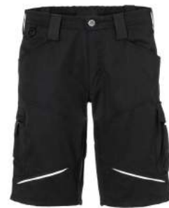
Schwarz 2950 5231-99 40-64