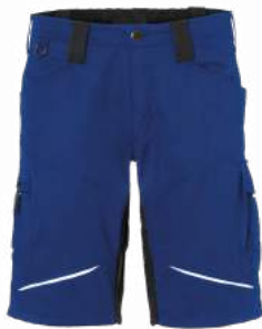
Kbl.blau | Schwarz 2950 5231-4699 40-64