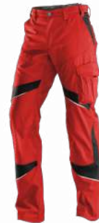
Mittelrot | Schwarz 2550 5365-5599 D34-D54