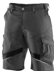
Anthrazit | Schwarz 2450 5365-9799 40-66