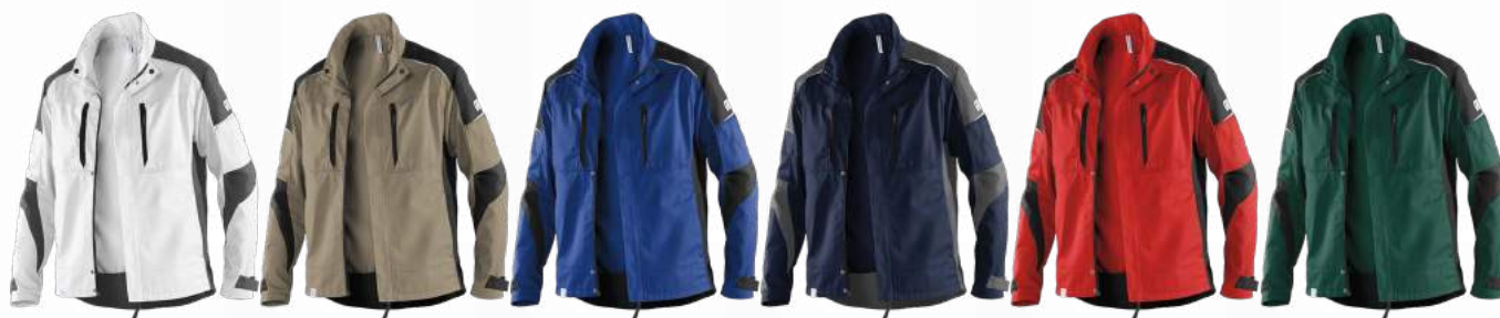
Weiß | Anthrazit 1250 5365-1097 XS-4XL