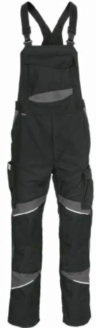
Schwarz | Anthrazit 3450 3421-9997 40-66, 90-118, 25-31