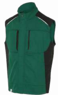
Moosgrün | Schwarz 7250 5365-6599 XS-4XL