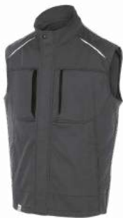
Anthrazit 7250 5365-97 XS-4XL