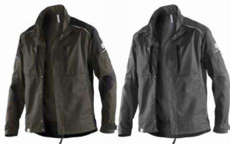
Oliv | Schwarz 1250 5365-6699 XS-4XL