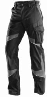
Schwarz | Anthrazit 2550 5365-9997 D34-D54