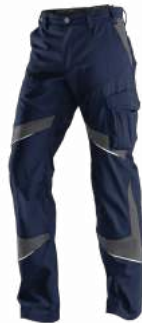
Dunkelblau | Anthrazit 2550 5365-4897 D34-D54